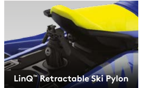
LinQ™ Retractable Ski Pylon

Первая в отрасли действительно влагозащищенная аудиосистема Bluetooth*, устанавливаемая производителем.