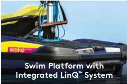
Swim Platform with Integrated LinQ™ System

Эксклюзивная система креплений доп. оборудования на самой большой в отрасли кормовой палубе — устанавливать и снимать доп. оборудование теперь проще и быстрее. 1