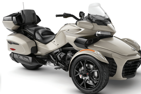
LIQUID TITANIUM DARK EDITION

* Компоненты и декоративные элементы доступны в исполнениях Chrome или Dark Editions