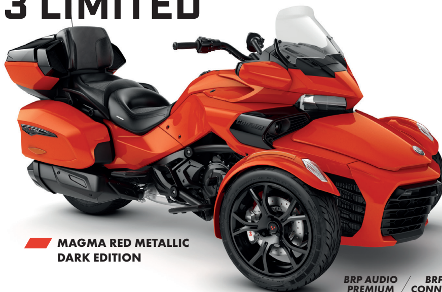
MAGMA RED METALLIC DARK EDITION

BRP AUDIO PREMIUM / BRP CONNECT / UFIT / ECO