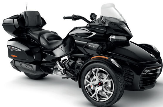
STEEL BLACK METALLIC* CHROME EDITION

* Трициклы Can-Am разработаны с мыслью о том, чтобы владельцы не испытывали трудностей с управлением и обучением вождению. Ознакомьтесь с требованиями действующего законодательства в части необходимости получения водительского удостоверения на право управления данным транспортным средством в стране вашего проживания. В большинстве стран, чтобы получить удовольствие от движения на трицикле под открытым небом, достаточно водительского удостоверения на право управления мотоциклами.